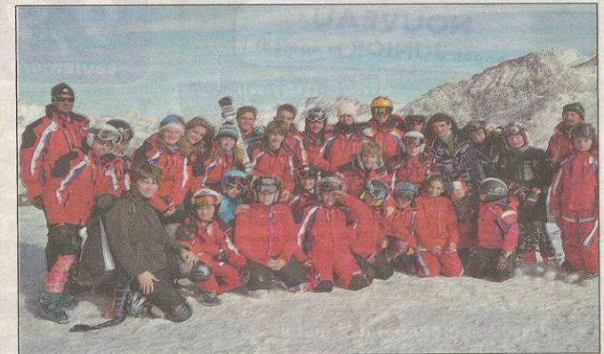
Les jeunes Valbergans réunis durant leur stage.